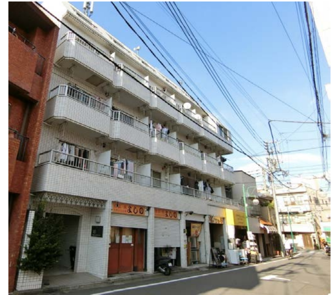
外観写真/2021年9月撮影