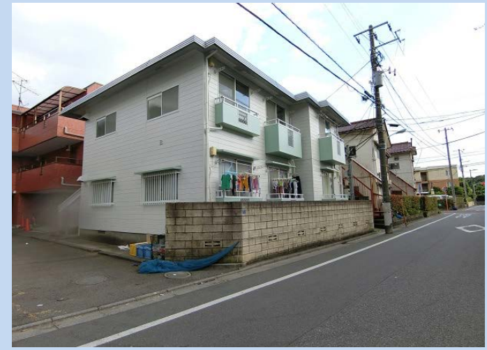
■ 201 / 専有面積 約39.7㎡(壁芯)