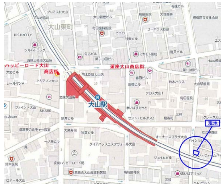
※概要図面です。図面と現況が相違する場合は現況を優先とさせていただきます。

●宅地建物取引業/東京都知事(13)第29798号 ●一般不動産投資顧問業/国土交通大臣 第1273号 ●賃貸住宅管理業/国土交通大臣(2)第1477号