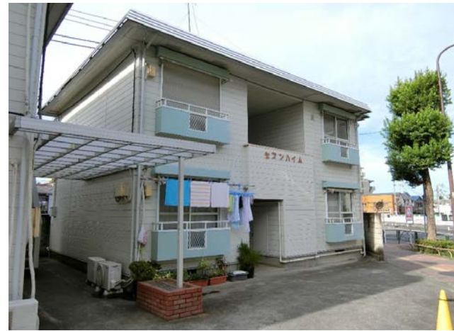
【平面図】 『セブンハイムA号棟』